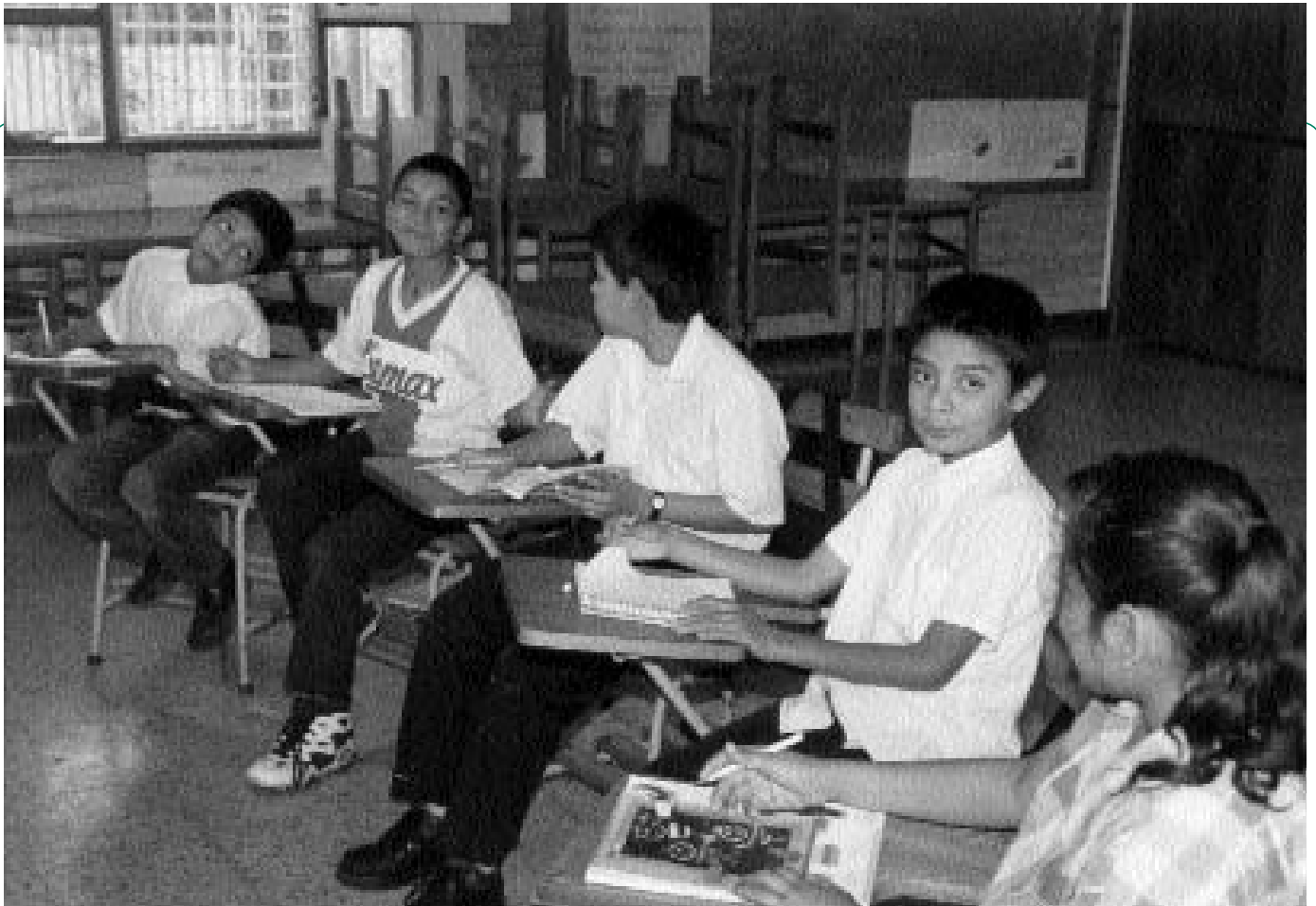
Entzuteko arazoak dituzten hezkuntza bereziko haurrak